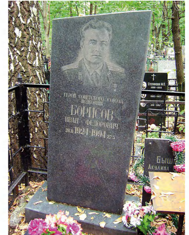
➤ Надгробный памятник установлен в Москве на Кузьминском кладбище (участок 8). Август 2010 года.