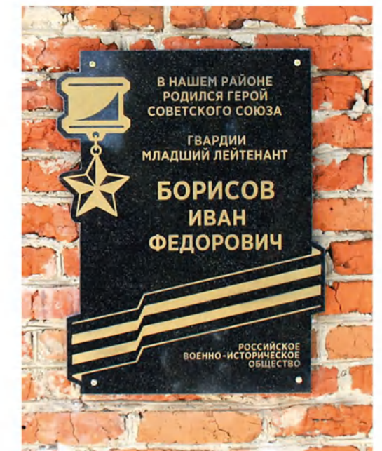
➤ Мемориальная доска установлена в поселке Лев Толстой Липецкой области. Март 2021 года.