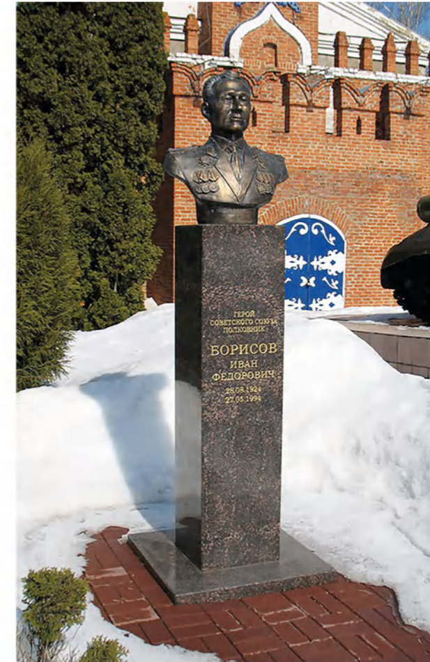
➤ Бюст установлен на территории мемориала Славы в поселке Лев Толстой Липецкой области. Март 2021 года.