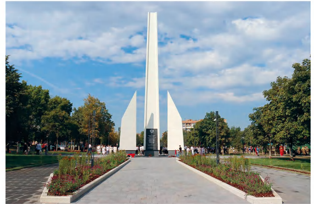
► Стела Трудовой доблести теперь стала священной доминантой городского округа Ступино.

— Открытие стелы — заслуга, прежде всего, жителей. Общественность вынесла предложение