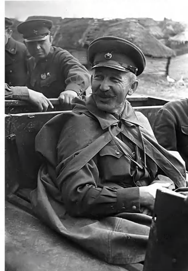
➤ Гвардии генерал-лейтенант П. А. Белов с офицерами штаба.

распылившего свои войска на широком фронте, постараемся вырвать у него инициативу.