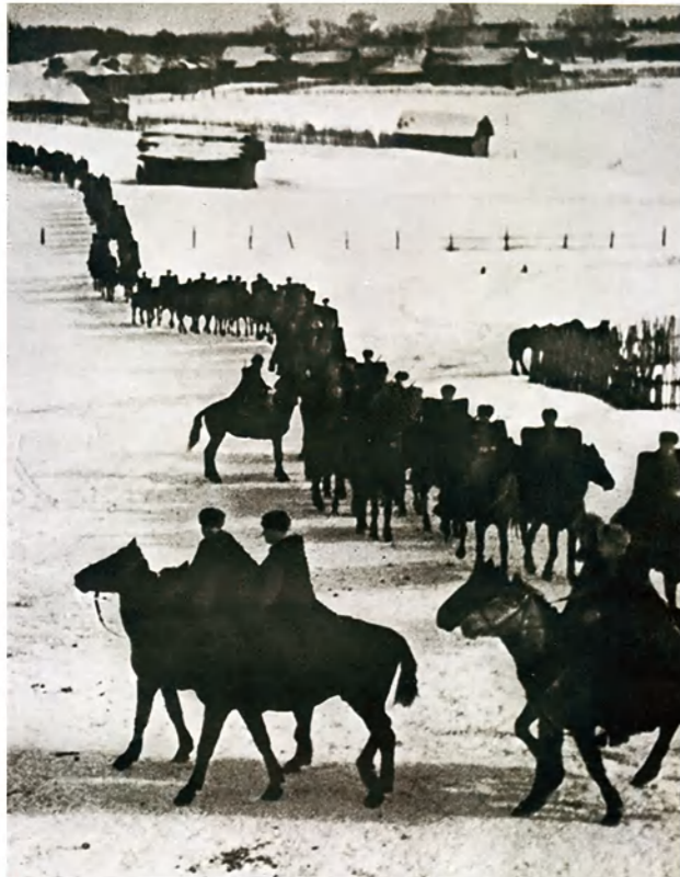
➤ Конники 1-го гвардейского кавалерийского корпуса на марше.

Зендикове и Мицком сосредоточены части 17-й танковой дивизии противника и отдельная танковая группа СС полковника Эбербаха. Немцы тоже вели усиленную разведку, готовясь к наступлению. Мелкие диверсионные и разведывательные группы противника действовали по всем дорогам в северном и восточном направлениях, пытаясь глубже проникнуть в наше расположение, узнать наши силы, устроить диверсии, вызвать панику. Наши разведывательные отряды и разъезды вели борьбу с этими отрядами фашистов.