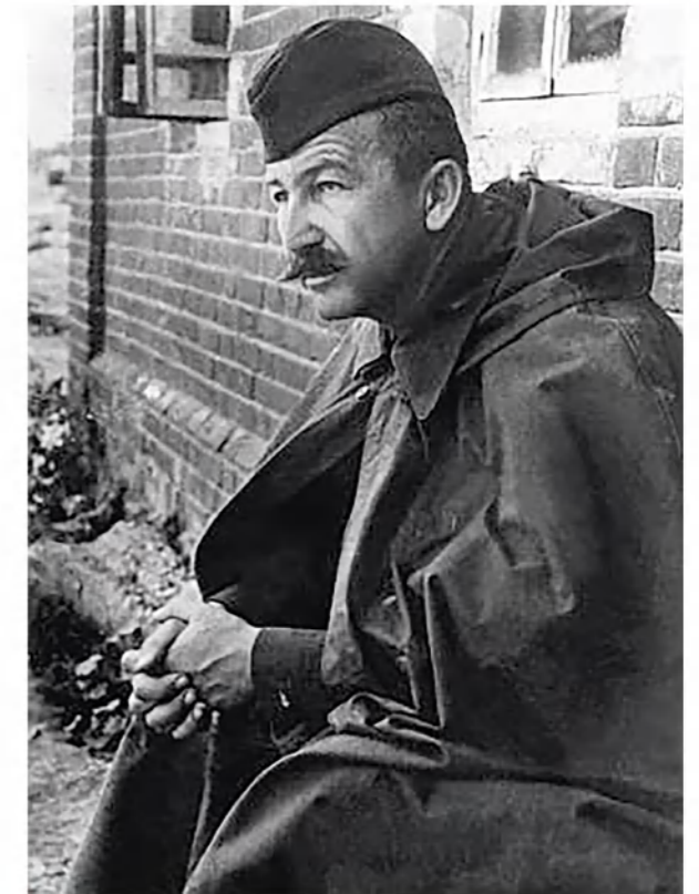
Гвардии генерал-лейтенант Павел Алексеевич Белов.

— Пусть работает, — ответил я. — И город, и ГРЭС будем защищать до последней возможности. Так и разъясните людям, чтобы не было никаких других настроений. А теперь у меня просьба к вам,