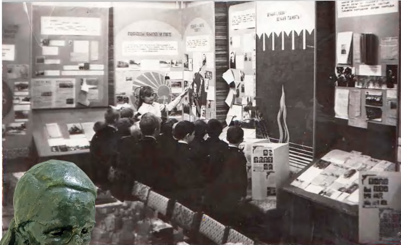
1980-е годы. Октябрятам проводят экскурсию в школьном музее.