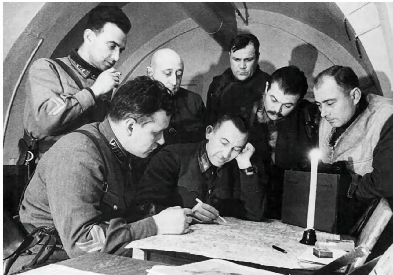
▶ Командир 2-го кавалерийского корпуса генерал-майор Павел Алексеевич Белов проводит совещание с офицерами. 1941 год.

Ступинцы с большим трепетом вспоминают имя известного военачальника Павла Белова, который в ноябре 1941 года не допустил фашистского захватчика на их родную землю. В свою очередь и сам Павел Алексеевич оставил теплые воспоминания о городе на Оке. На страницах альманаха «Воинская доблесть» публикуем выдержки из его книги «За нами Москва».